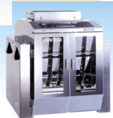
自動電子計量機 クリーンマルチスケール Cube